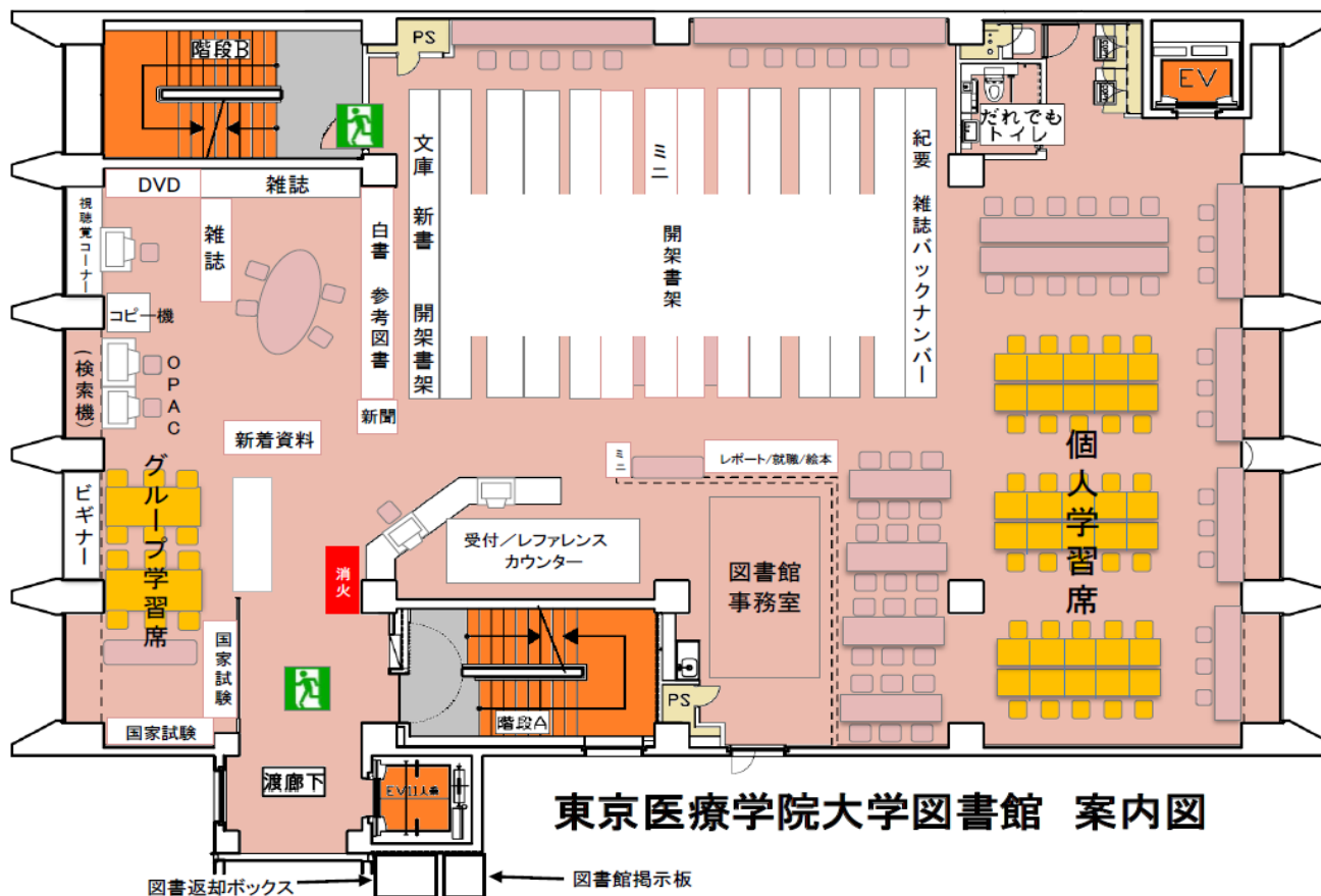
東京医療学院大学図書館 案内図